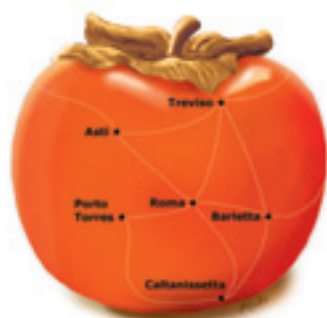
21ª regione italiana

ristorante Tacabanda Asti, consorzio operatori turistici Asti e Monferrato, ristorante Enoteca regionale di Canelli e dell'astesana, gelateria veneta Asti, studio Arch. Maurizio Galosso bottega del Grignolino di Portacomaro d'Asti az.agricola F.Lli Durando Portacomaro d'Asti, az. agricola Pavese Montemarzo (AT), chalet Le Betulle Santa Caterina Valfurva (SO), caseificio Prolat Torre San Giorgio (CN), az.agr.bio Poggio Ridente Cocconato(AT) macelleria e pastificio da Nico e Simo Asti pizzeria eclisse punto pizza Asti caffetteria Toju presso il Teatro Alfieri di Asti Hotel Bar Agorà Calamandrana (AT)